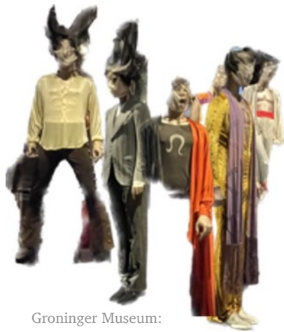
Groninger Museum: Rolling Stones expositie

Eerlijk gezegd heb ik mezelf lange tijd privé en zakelijk strikt gescheiden gehouden. Zo had ik in elke rol een eigen pantser: in mijn rol als moeder, als manager, als projectleider, als partner, als vriendin. Alleen een paar hele dierbaren liet ik alles zien: mijn talenten, en mijn schaduwkanten, mijn weten en mijn twijfels. Even vindingrijk als vermoeiend.